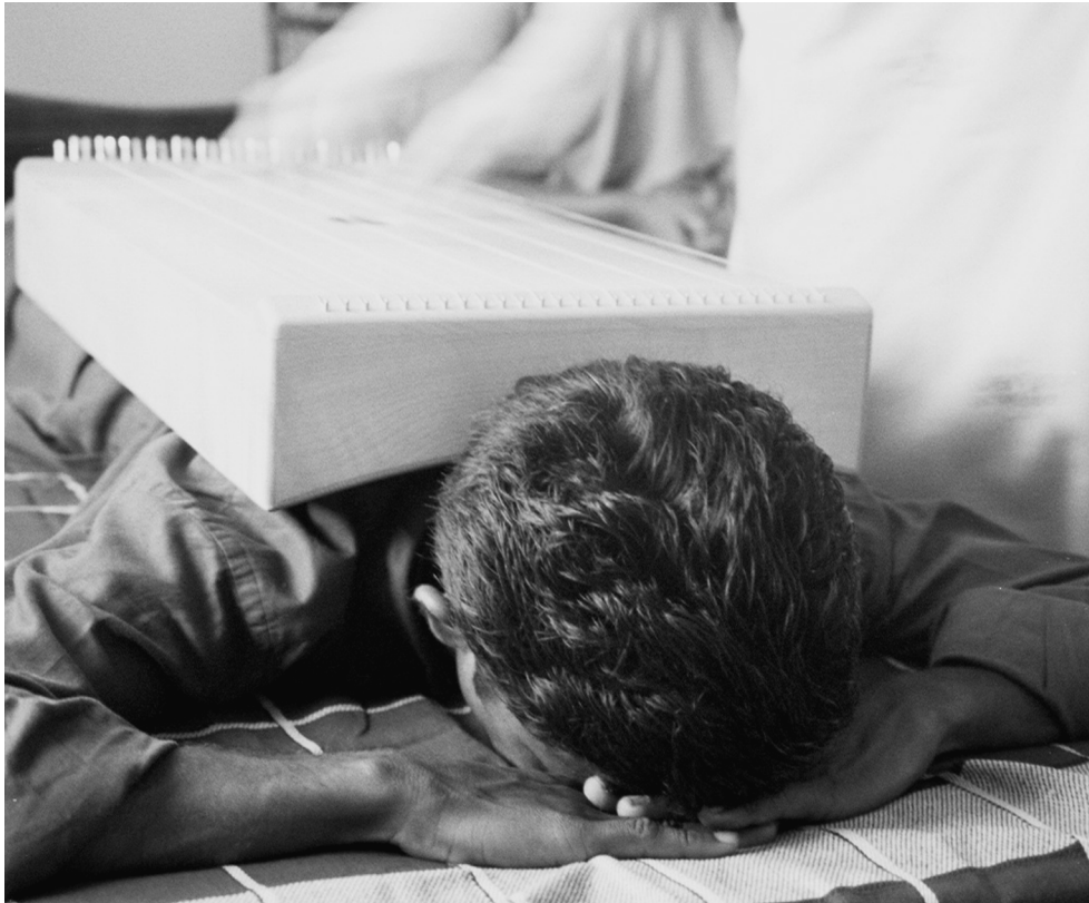
Abb. 4 Indischer Patient wird bespielt