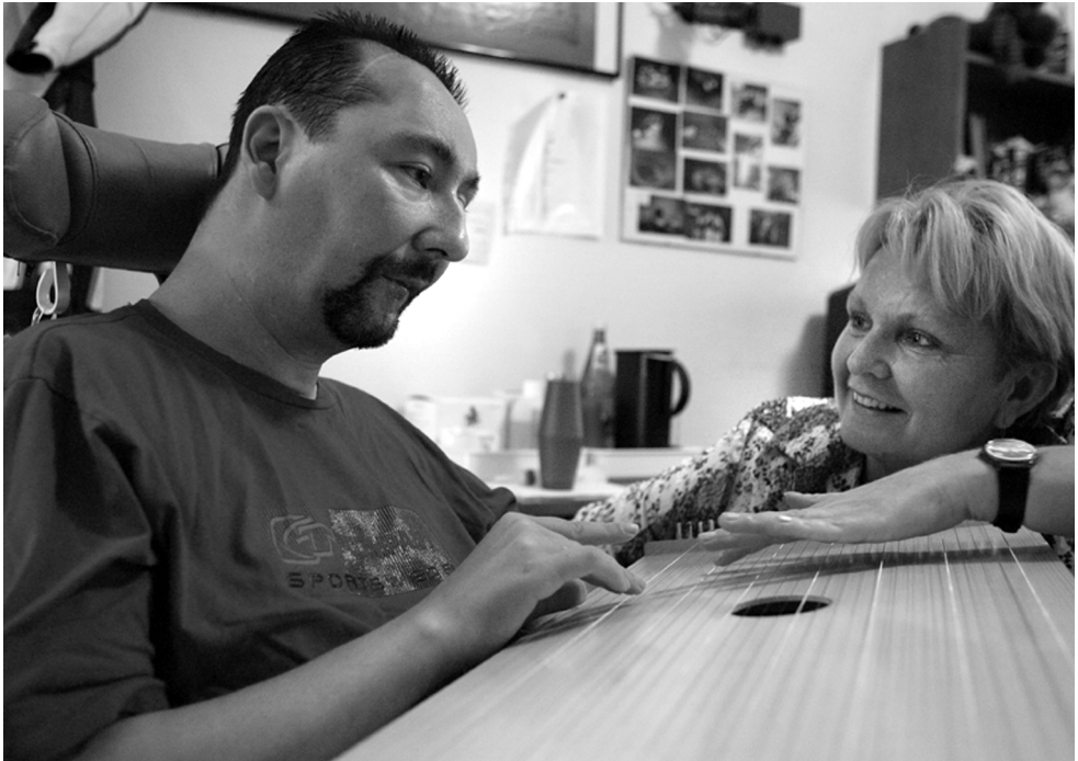
Abb. 3 Wachkomapatient spielt aktiv auf Tambura

Inzwischen (März 2005) gibt es ca. 50 Körpertamburas, die vorwiegend von Musiktherapeutinnen, in zunehmendem Maße aber auch – und zwar deutlich mehr als andere Instrumente – von Behandlerinnen aus anderen Gesundheitsbereichen eingesetzt werden (Ärztliche und Psychologische Psychotherapeuten, Logopäden, Ergotherapeuten, Physiotherapeuten, Atemlehrer, Yogalehrer, Sterbebegleiter).