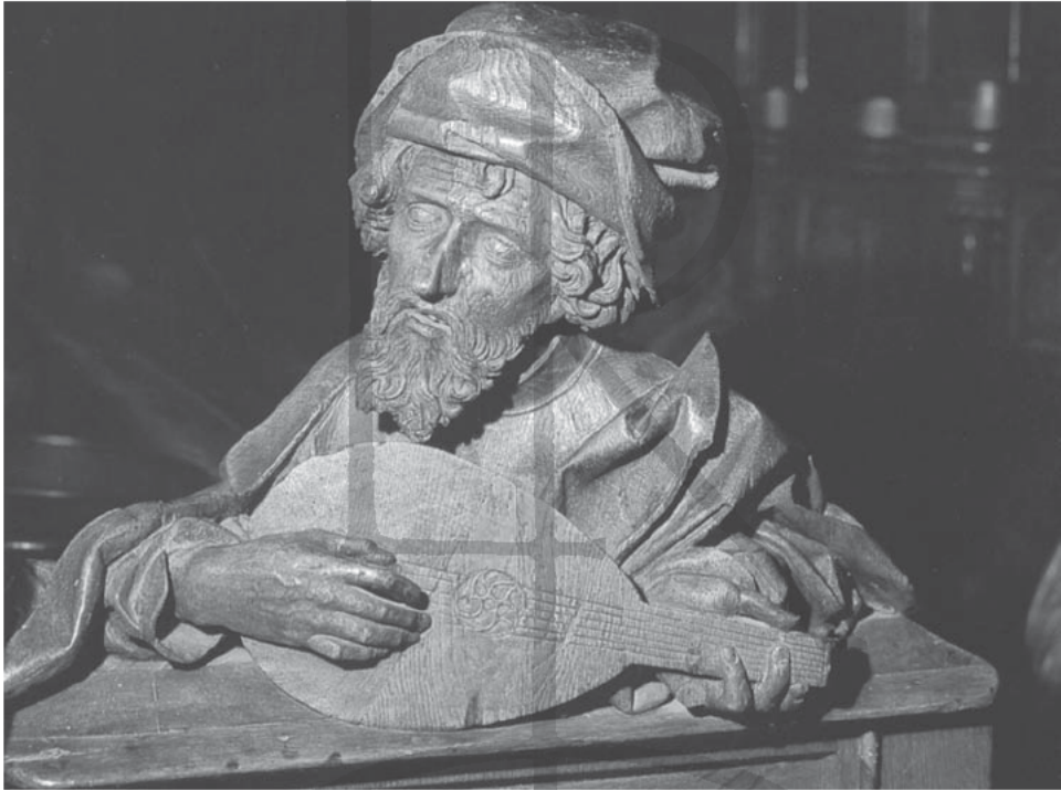
Pythagoras mit Laute im Ulmer Münster (oben) und mit Monochord in Chartres (unten)